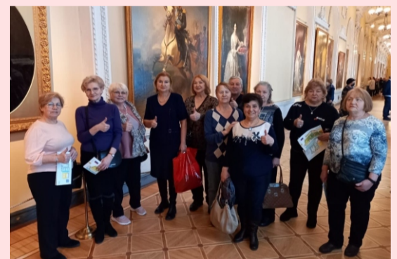
КУЛЬТУРНАЯ ЖИЗНЬ ОКРУГА СТР. 4