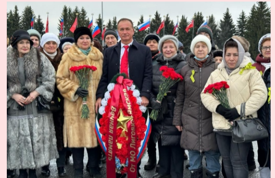
НАШ ЛЕНИНГРАДСКИЙ ДЕНЬ ПОБЕДЫ СТР. 2