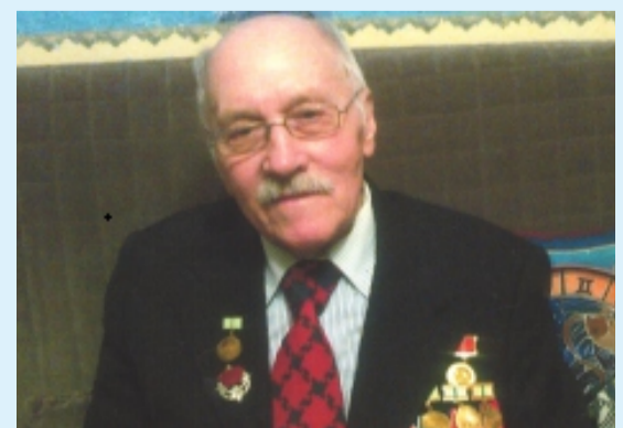
ГЕРОЙ НОМЕРА СТР. 8

Вопросы можно задать по тел.: +7(921)314-58-54