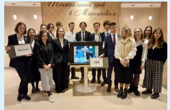
СТРОИМ БУДУЩЕЕ, СОХРАНЯЯ ТРАДИЦИИ СТР. 3